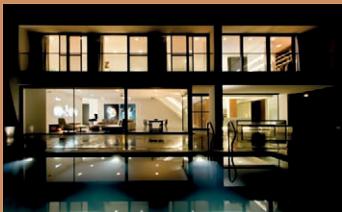
Nachtelijke sfeerbeelden - Doorsnedelgrondplannen van de woning